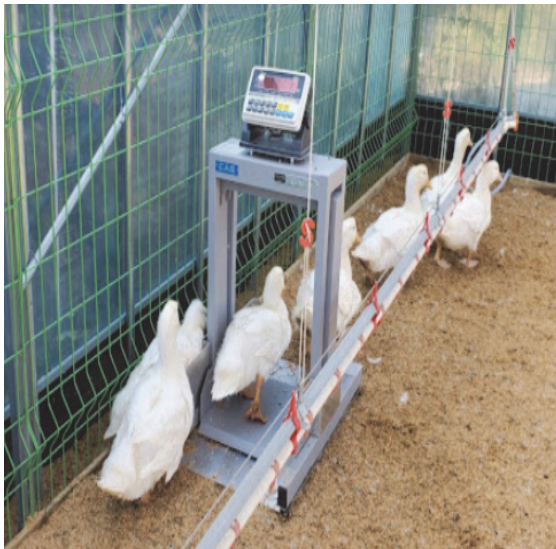
Fig. 5. Field real test.

그림 5는 본 실험을 위해 제작된 소형 사육동에서 약 10여마리의 오리를 실제로 투입하여 제작된 중량계의 저울을 지나가도록 구성한 사진이다. 완성된 중량저울과 데이