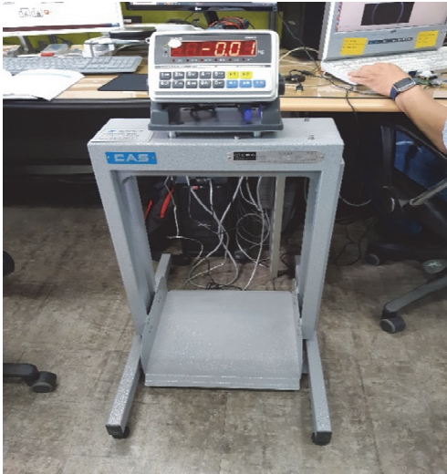
Fig. 3. Weighing device prototype.

측정된 데이터의 정확도를 위하여 (주)CAS로부터 제작된 중량계의 분동을 사용한 검교정을 실시하였다.